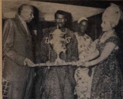
Aworan oke palapala yi ni igbati awon asiwaju Egbe Onise-Irohin ti Najiria niye ife ominira nla ti