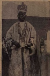
Ojuba Ladapo Ademola Keji Oba Alajelewa Alake Abẹkuta

Ninu oju ti awon Ijo Musulumi Egbu si ki gbogbo enia Iu Egbu ko-ore fun gbogbo Ominira Ijuba Apapo Naijiria ni nwon gba trinita, oju iligwalu eko fun awon omo imale ati imakale esi lalan. Nwon si be gbogbo Musulumi Abẹkuta pe ki awon Ijuba je iranlowo owo-dida fun Mawotan Jimi Abẹkuta, ki awon si pese ile-eko gba tun awon omo Musulumi lokotari ati lokotari, ki awon si da