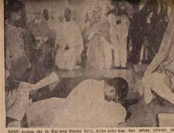
NINU awon ade yi. Eni-owo Bişobu Felix Alaba Jobu kan...