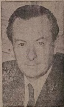
Aworan yi ni ti Oloja Julian Amery, Minista Alabojuto Eto Oke Ofurufu fun Ijoba Ilu Gesi. Omo odun merinlelogoji ni, o si ti fi igba ka a se ise oniwe irohin ri ninu ogun.