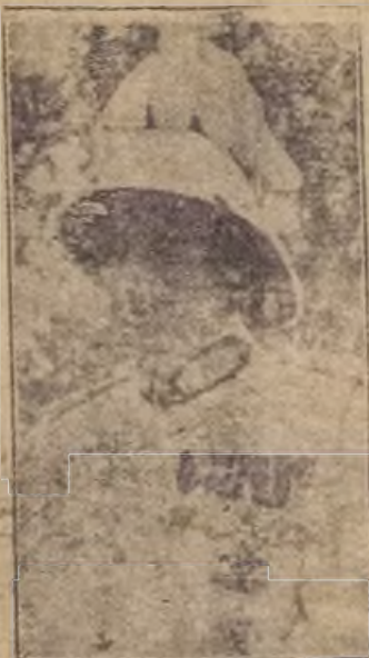
Eniti a nwo yi ni ologbe Sir