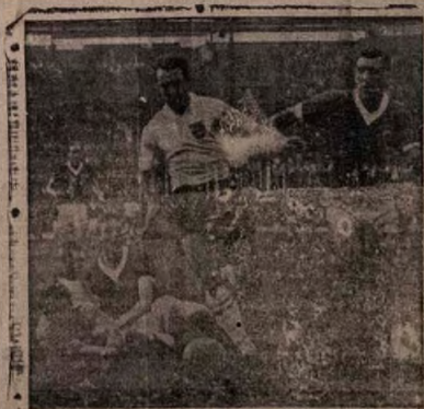
Awon Ele- se bolu afe- se gba ti ilu Oyinbo ti awon fi nko wa lo- wo lo niyi.

Ko si iya, ko si si baba, tani on tun ni ti yio se ajo on? Bi on ba kuku ku, on a lo sinmi kuro pinu wahala aiyẹ yi.