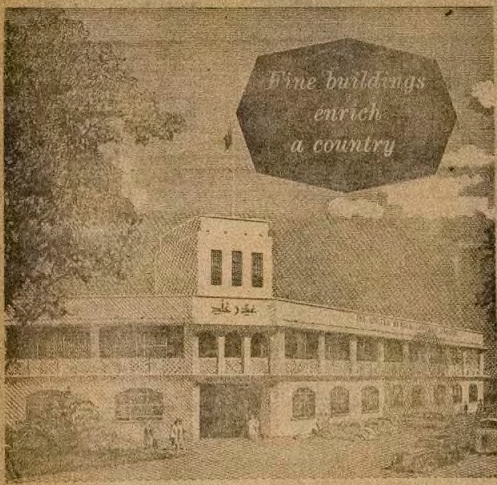
CIDAN GOLDIE, KANO

NOW, AVAILABLE BUGLES, BEDSTEADS, PAINTS DISTEMPERS, SAPES Etc. Just write, Call, or Phone 21372 IKORODU TRADING COMPANY 20/28, Balogun Street, (P. O. Box 395) Lagos, AND NEW COURT ROAD IBADAN