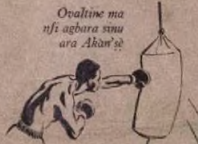
Ovaltine ma nfi agbara sinu ara Akan'se

Lati mu ara mi le ki o si jafele emi ama fi onje to darajulo fun u emi ama mu Ovaltine lojojumo, hena ni iyawo ni ati awon omo. Wara mbe nmu Ovaltine, ati eyin, ati koko pelu 'Vitamin' ti ima otunni ni ilera, agbara ati okun.