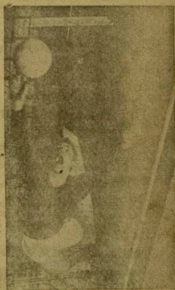
Aworan ti a nwo yi lati o-olu Oyabo Gai, Cgbere Gordon West, ti o nse Asole ere bala afegbo (Gambler) fun egbe clere bolu ti a ope ti Blackpool nla Oyabo.