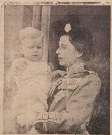
Eyi ni Aworan Alaiyeluwa Oba Obirin Elizabeth Keji pẹlu omo' iṣe okuntin kokore, omo Andrew to o wa loju Alaiyeluwa lori oke Afin oja Buckingham ni London, iṣhinti Alaiyeluwa ti gba ijuba awon omo Oguns ibi ojo ibi re.