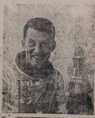
Ogbeni Walter M. Schirra ti e nwo aworan re yi ni enikarun ti awon Ijoba ile Amerika ko ran lo si oke sanmo wipe ki o lo wo bi ohun tiri. Aso ti o yato pupo ni awon da fun fun irin ajo si orun ra. Ogbon ti won ogbon, nwon ti tun fi nkan alarabara si aso ti Ogbeni Gordon ayorunbo ti o lo siru awosama laipe yi.