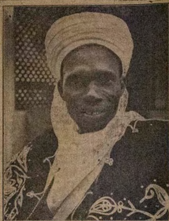
ALHADI TAFAWA BALEWA Olotu Apapo Ile Najirja