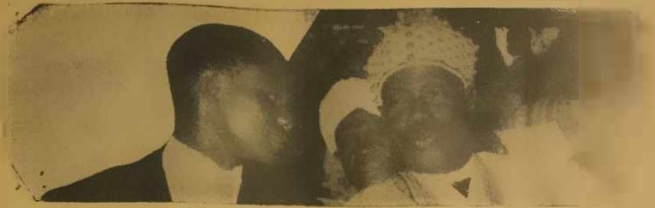
Oba Adele Nki Hogan, Keji, ti ilu Eko ni o ari Hogun "King" Bassey Oba Akon-ran, abaye ku ni oke ni abo Bassey gha'yi a gb'eye.