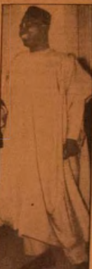
Olaye Obafemi Awolowo

awon Egbẹ Alakoko bi awon iṣaṣe aṣoṣa kan bi ti seje pelu won bi won yi tule aṣa si i gran na re iṣa- 'awo lati ma si d' gborin se bolu-bolu fun awon ara lu pe ki ero awon ara lila bi darigba, awon aṣaṣa ni won ti agun aṣaṣo, o ni eyi ni ko jeki on ko akanan si. O ni tẹlẹti o se ti awon alagbaye Azikiwe wa ona ti won a si fu on boro gboṣin ti won koo ni Wo oju aṣe berin