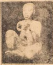
iti o kan ere abami kan o so wipe lati igbiti on ti ni

JOS. Ogbeni C.P. Thurstan Shaw ti se okan ninu awon ohun isedale enia dudu, wale