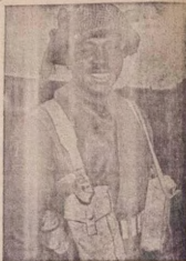
Oni Fa owo nro aworan yi ni ena dada ti owo kọjọ ni oye "Equerry-Asoju gba tabi wo'lo-wo'lo epe obirin, Eleroboti Kaji oigbatu o; wa bo jile" Nigeria wo nise, odun 1956.