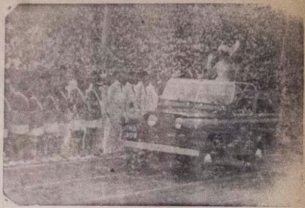
Aworan ti a ruo si ni'o lo afihan awon omo emu ati awon omo ilewe ti nwon se gba fun Omoba Alexandra Nilu Ibadan nigbati Omoba na de ilu Ibadan.