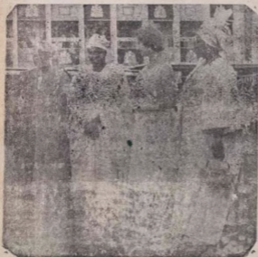
E wo Aworan yi, awon awon Ijobu ni Ijobu ni Agodi, Gomina Iwo-orun Oloye S. L. Akintola, Olotu Ijoba, Omoba Alexandra ati iyawo Oloye Akintola.

A oju wipe ile awon ode niki at ko jara silu Ibadan je iwaju ogun Ibadan lo.