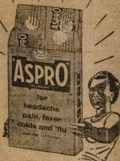
Paketi "ASPRO" titun yi wa fun tita nistari nistari. Šile kan pere ni owo nira re. Koru odugbo "ASPRO" mejila ni o wa ni eni re. Ni-zinzi, enikeji ni ni "ASPRO" ni ipamo awon lati ma a lo o ni gbara ti o ba ti ni OTUTU-IBA. O ko lo mo igbati OTUTU-IBA yio kolu o tabi ebi re. Mura si. Pa paketi "ASPRO" titun on. šile kan kor 11