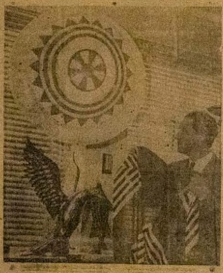
Aworan ti o nwa loko yi ti ti Ogbeni B. verly Pck, eniti okiki kan kakiri agbaiye egbegbi yaworan-yaworan Ogbeni Pck ni o nya aworan ti a o fi ko so so okiri Eko fun ayoye Ominira Najira. Ogbeni Pck ni o ya aworan re ni ile-re re ni Londongu nihi ti o gbe awon aworan ti o ti ya fun isopọ ni titi Eko.