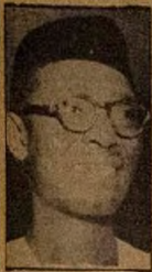
Dokita Nnamdi Azikiwe