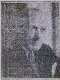
OGBENI OLIVER LYTTELTON Asoju Ijoba Geesi fun awon ilu Amofa Geesi (Secretary of State for the Colonies).

Ebiti o wa lori oye Baworan yi ni asiko ogun ajakaiye Keji Ki Ogbeni Clement Attlee to wa gba ipo re nigbatu ogun pari. Lodayani ni on na si fun wa gba ipo na pada lowo Ogbeni Attlee.