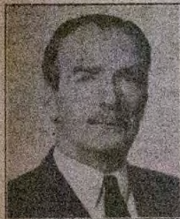
OGBENI ANTHONY EDEN Asoju Ijoba Geesi fun awon ilu omirola. (Foreign Secretary of the British Government.)

VOL. IV NO. 695 IBADAN, MONDAY, DEC. 28, 1941. OLU IWA IROHIN YORUBA (NO. 1) 10