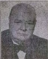
Ogbeni Winston Churchill Oloye B-soran Ilu Geesi (Prime Minister of Great Britain)

Ebiti o wa lori oye Baworan yi ni asiko ogun ajakaiye Keji Ki Ogbeni Clement Attlee to wa gba ipo re nigbatu ogun pari. Lodayani ni on na si fun wa gba ipo na pada lowo Ogbeni Attlee.