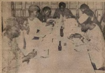
LAMPE ni awon abokunwag olopa na fun ojo 26 na Nigerian Tribune ti da... Ag kan da Olatu ina Irohin Niwa aworan kintu ti o ja Nigerian Tribune foto layi Ogheni I. K. Jakande ti o ja Ninu ti awon olopa nina ti oja patapata ko lag fa ni o ja awon si da ala foto pipara... peja die nin awon olopa fa