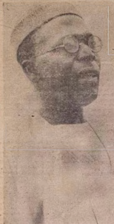
OLOYE OBAFEMI AWOLOWO

NI oni yi gan an ni Oloye Obafemi Awolowo ti o je Balogun iran omo Yoruba di ẹni odun marunlelogota gbaka. Awa ẹni awon enia afata miran ni arileede yi ẹni ni ile okere ki Oloye Awolowo pe BARIKA. TI enia ba bayawo ehin ti o ni la oju sile, ni aluware nri gabgabo oshun ti nkeja ni agberiyi aluware yio ma ope du lawa. O orun ti o da emi an si.