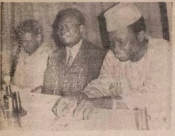
lag na subiti awon ti oja awa... Aworan kintu ti awon lati awon nin ni Ogheni Jakande, Ogheni Iban Yakobo, Olatu Nigerian Tribune Ogheni A. Diapo.