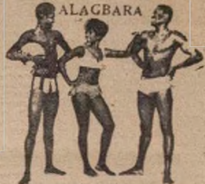
OGUN abugante pataki ti awon olopa lomo ti o nima ki i'okunfa i'okunfa ti awon ba gbe gbo sanyo daradara pata awa ni o lafafia.