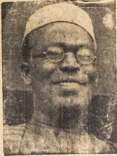
Oloye Obafemi Awolowo