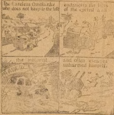
The Careless Omolanke who does not keep to the left