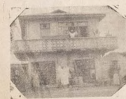
Aworan oke yi ni ti Awon ile to jona ni Igbara Oke