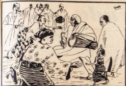
Ƙ ha a t'ennu b'epe k'ę tę'nu bęre, qdun qdunni o yabo!!!