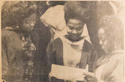
Aworan awon omobirin ti a nwo lake yi ni ti dle ninu awon omobirin ti a won ko eko awon pari nina ile eko ni Uniforu Ibadan nipari egi ti o koja lo je, ti awon omu na si gboye imo eko ipale ninu ile eko na. Awa Oshun Irohin Imole klawon akoko na ku Orire a si fun gbadura pe ki Odeun jeki awon le ti ipe zere pe, ki ku Orire o, ki si jo wa ju!