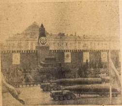
A seran ti e nwo lole yi ni ti awon Sija ti awon n'ere kakiri gbo bo ode ni oyo na ni dagbe kan ti nwo n'ape ni RED SQUARE ni oia Ila Rosia ti awon npe ni h'oso - oio na. Iohin fi ye wa wip; yika ghogbo eni agbaiye ni aw n enia silu ede ilu Rosia se ayi e di n na ni ojo na pa-julo ni gbo bo orile ode ti Rosia gbe tini awon Asa ni Ijaye. Awo so ti eni o loko lwe yi ni ti swa Soja ti awon yika ghogbo ila ni oja na

igba ati akoto, ti Ipe kedu dun ti omokoronin sun ti o ko ji fa be omokoronin sun ti ko ji fa ni agbe wo ni ole so ara kehin oko, Sunday wo to mo ti o mase k hin oio aise re tabi Ijaye - lo na ba wa ki? so lu mi tabi ki o bere lwo ar re, Bi o ko ba re dahin esi yi ijaye re to se Ipe nina nina oia o pe re mu sira Ija tabi Ego ti e gbo se ni awon Kristi nase to pe kon oio to eri le mi ti a lu wa, Kuntip Obitun ti o ti Jesu Kristi da Ipe larin: pe eja Mark 12: 4, 3, awa ti ka ti o wa Ipe Kristi Oloro ni oji Ipe Kristi nik, bu o da oia