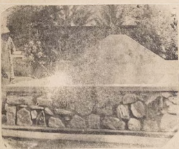
OGBOMOSHU: — Irohin ko to sojuba ni ti Olo ye S-muel Lad-ke Akintola, Afe Onakpanfo, enit o ni f'igbaka fe Alakos i jio-ba i pinje iwo Onu Nalji na nigbatu awon Soja gbe oku re woa ni ilu Ogbomoshu ninu ete ti o kaja lo yi. Iroh ni fi wa wipe igbati o ti di ase kan ti Oloye na si ki, ni awon Soja to gbe oku re na kuro ninu ile Iwasan Latulaku Ibadan ti awon si gbe Oku re lo si ile re ni Ogbom sho. Aworan ti e nwo loko lwe yi ni ti ijo-ba ti awon sin oku Oloye Akintola si ni ope na.