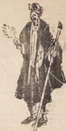
Oba Alaiyeluwa Oduduwa

ENYIN OMO ODUDUWA "OBA ATERERE KAIYE NKI NYIN" PELU OPA AJASEGUN RE