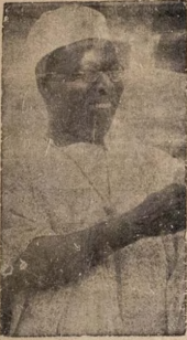
Oloye: Obafemi Awolowo Olori Ego Alafife e