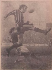
At kini okurin yi tso? Njira taari hu aworan yi si a gbejade tso? O ku si y' igwe.

AWON Olopa ni Sapete ni Ipinle Ado-Ibinu ti mu omo (dun mejo) kan ti wona fi eruku bo l'asiri loel ezun pe o yinbon pa ahuro re.