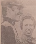
Awonran oke yi ni awon Arzembirin Obabirin ti Gesi na Ojo Anso pelu oko re Ogun Mark Phillips bi awon ti fagbekede ti awon si alo a'ede alon eke syykile onifaji ti tistaya wu ma si digbi gbeade, Iru ipo yi ni awon se pe iwo wa faji ti wu wa won na.

NI NSE ni ata la moto syykile onifaji ti Arzembirin Obabirin ile Gesi Ojo Anso ati Basile re Ogun Mark Phillips wa ni re jerejere nigbati awon se pe okunrin kan ti o faji yi tiki, laya na gbe daju ibon ko moto na.