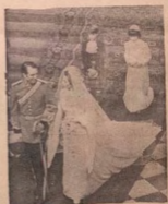
Aworan eke yi ni eke afihin Aramabinrin Oshabirin ile Gresti Olole Anne ni ojo igbeyawo re pelu Oagun Mark Phillip Waju awa kof, fun irohun ohun ti o si eke si wyo.