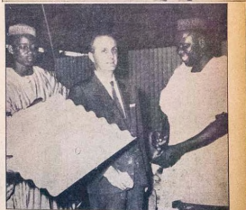
AWON aworan wonyi nise ayeji ise ise "asbestos" simenti ni Ijoba ni oje Abameja ti ise oje kedegbe eni ti o kaja yi. Awon enia ja-nkan ja-nkan lo wa sibi isile na. Oloye S. L. Akintola, Alakoso Ijoba Ipinle Iwo-Orun lo si ile-ise na. Aworan oke yi patapata I'gbe oton ni ti igbati awon alabapere nye ile ise na. Aworan oke keji ni ile nise awon enia pataki-pataki to wa sibi ayeji na. Aworan oke yi ni ti igbati awon alakoso ile-ise na nfun Oloye Akintola ni oton "asbestos" kan.