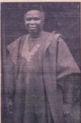
OLOYE S. L. AKINTOLA

Ninu agbara epe ni awon enia ba a pebi ibon babu re legbe re.