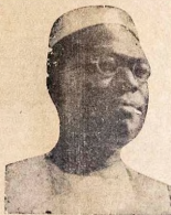
OLOYE OBAFEMI AWOLOWO

Ogbeni Odesanya se alay- e pe, adajo Agba Sowe- mimo ro pe, igba mejila ni Umoren lo si Ghana nigbati