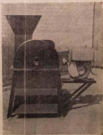
(GARI GRATER N350'00)

A mu irohin sjo na wa fun nyin foni pe: Oniruru ero, ti o nlo ina ati epo ni a ni fun tita bayi. A ni: Ero ti a si sjo bulogoku (Block-Making Machine), Ero ti a si nris gsari (Gari Grater), Ero ti a si nra akura (Palm Nut Cracker), Ero ti nfun ni ni ina lentiiki (Generating Plant), Ero iggedu (Solo Chain Saw) Ero lita (Beco Grinding pepper), Ero ti a si nra taya, ti a si si akun moto (Air Compressor), Ero linskoko (Solo Sprayer), Ero ti spon ayun (Saw Sharpener), Ero ti sjo bulooku alarabara (Vibrating Block Machine), ati Ero ilagi (Circular Saw Bench) fun awon ti o da ile ise lagilagi keekeke sile. Ki ise iwonyi nikan ni ero ti a ni. Ani oniruru miran, A ntun ero ti o ba baje ro si tootun. Hi enia ba si so fun wa pe ki a ba oun ro nkan-kan; bi o ba ti se apejuwe iro obunkohan ti o ba fe ki a ro, lisekepe ni a o roo jussile fun oluwate.