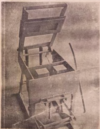
Block Making Machine (N300'00)

Nje o ti ri oniruru ero ti a nje ni ile ise wa? Nje o ti ta minu ero wa? Nje o si ti wa silo ise wa nibini a ko awon ero wa jo si? X X X X X Nje o mo pe awon ero wa wonyi ni o darajulo, ti o ni slope julo, ti owo ti si kere julo ni ile Naijiria?