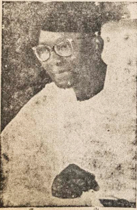
Dokita Nnamidi Azikiwe

Ninu oḡe to koja yi ni awon igbimo eto ibo didi se ikede fun awon egbe oḡe. Lu ti yio gbe apoti ibo si laseko id bo si ipinle igbimo as fin ti apapo Ijoba ile Naijiria pe ki olukuluku tete mu amin ti awon yio fi di bo won ki ipari osu yi to dele a i pe ki awon si ile mo tri ami yio wa ni apoti idibo ti egbe oselu kokan ni orile Naijiria,