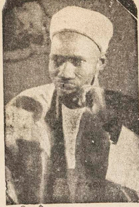
Alhaji ABUBAKAR TAFAWA BALEWA Alakoso Ijoba Apapo

Awon igbimo eto ibo di di fun apapo Ijoba ile Naijiria siti bere lati marin irin ajo kakirin ipinje ile Naijiria ati lati lese abego awon ipinle gḡogbo towa ile Njiri ni Awon igbimo eto ibo na yio p ri irin ajo si ipinle Ariwa ninu oḡe keḡala osu yi, Nwon yio tun se abewo si ipinle Iwo Orun Naijiria lati oḡe keḡala si oḡe ketalelogun osu yi Lehin na ni awon igbimo na yio tun se ihewo si ipinle Ila Orun Naijiria lati oḡe kerintelogan si ogbon oḡe lati fi kasḡ irin ajo won