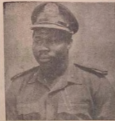
OGAGUN OLUSEGUN OBASANJO Olori Ijoba Naijiria

lo, enikeni ti ile ejo adigunjale ba dalebi iku, ti Gomina na ba si fowo si i, kiakia ni awon yio maa pa a.