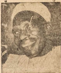
Olola Alhaji Abubakar Tafawa Balewa Alakoso Apapọ Ijobe Naijiria

ise oju kejidintogun oṣu yi ati pe awon omo egbe na si nba eto orṣo won lo lori imura sile ati a dehun ti awon egbe na yio si jijo fi owo si lati mu ero ajumosepo won lasiko idibo si ile igbimo asofin ti apapọ Ijoba ile Naijiria na eyiti yio waiye ninu oṣu kòkanla odun yi gẹgẹbi irohin ti ari gbo labele na.