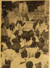
Aworan yi ni ti awon egbe ošise ti Ogbeni Imodu okan ninu awon asiwaju egbe ošise ko lo siwaju Ile Igbimo Apa-pe Ijoba Naijiria ni oje 'Ru ti iše ogunju ošụ yi ti nwon lo fi ibinu won kan Ijoba pe awon tako didaduro edegbanu (1,700) awon ošise ti nwa edu ni Enugwu ti Ijoba fe da duro.

IKO. OJU ogoran awon omode lo, Iykanrin Iabirin won ti nwon niwọ jina Oduku fun igban abayo Oduku Alade ni oje Aje ti iwe oje kelleidogun nso ni. Nitoto nwan ko wa lina pupo, ti Omi-okun ba ti sru-ko ni awon ti nso soko. Ere won na dun pupo, gngos o mu ewi dani nito, rife 'Eyo ogoran ni Omi Okun, o kopa ohan ti a ta fun oju de sere." Enyin oki ekin fun awon oju nyan o