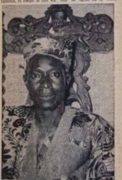
Aworan oke yi ni ti Oba Alaiyeuwaa Gaa-degshin Ladigbolu Keji, Alafin Oyo nigbati nwon yan an Alafin.

Ko pe pupo bebin eyi ni ogun joko kati ti awon pe ni ogun Gbodo be sile larin ile Yoruba, Oja, Elebu, Atiba ati gboogo awon enia re ni Melorun na, Oja ni silaro ogun egbe kan ti o ma a trait an lowo lati le pada wa sile bi ogun ba fe toru