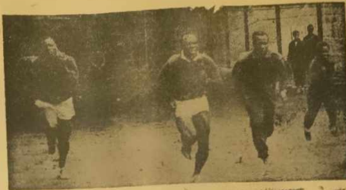
Awon elere a nwo yi ni awon omo ile Nigeria ti o lo bi won so idanranwa oro Maraya niu Cardiff. Nibhati awon da obun awon ko fe loko taradara ni nwan so awon i owo awon faw idanranwa. Olowa wa ninu won. (Idafin wa niba si) Osiogbo wa niba psu.