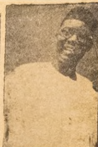
DR. NNAMDI AZIKIWE