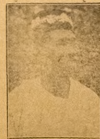
Oloye Kola Balogun ti o je