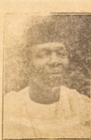
DR. K. O. MBADIWE