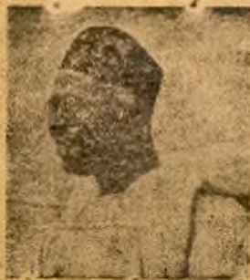
OLOYE AWOLOWO Lehin ti Awolowo lo tan