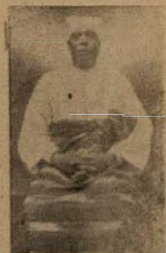
awon ni sika ti ni oju kejo ota December, 1959 yi, larin

EKO. Gbete fa gbe ika Olo- ye Modile Bando, Modile da Eko ni oju kejo (ju 3).