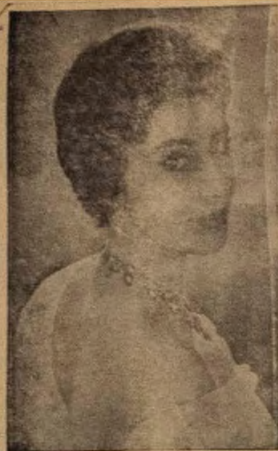
Iròhín tí sọwá lẹ́tí fẹ́rẹ́n wípé Aláyélawá. Ọ̀bá Ọ̀bírín Ilú Oyínbo yíò fí omọ́bá ọ̀bírín tí orúkọ tí nǹkẹ́ Margaret tí a nǹwọ́ nǹwọ́ àwírán yí rǹnǹ wá sí àyọ́n rẹ́ nǹgbo Omírín Ilú Nǹgíríá 1960.