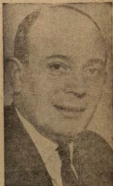
Eyi ni aworan Gómíxá Bǹnkí, Ilé Hówopamósí tilé Nǹgíríá ní Oloyé Okótíé-Ebók pé wá sí Olotu Bǹnkí ná. Orúkọ́rè ní Ogbé ní Roy. P. Fenton.