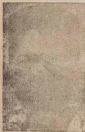
Oloye OLU AKINFOSILE

Oloye Akintola si gb gbo wahala ise ti omo Yoruba se ninu ise oḣelu awon omo