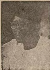
Olofin NNAMDI AZIKIWE

Iho ni awon nje anfani ibe. O ni gbogbo eniti o ba nfe ilosiwaju awon omo Yoruba ni lati wo egbe Demu tuntun yi.