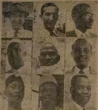
Twoy ni awon ita rapo nipa awon igbimo Nigeria Central Marketing Board.

Ko nre ojo ghogho li o ndun gepchi odun Kerest-mal, bikuse ki enia ko lati ma fi ori ti i. Eniken ti o ba si nre je ogbon ni lati ma ka iwe li ede Yoruba ati li ede Gese. Anfani kilu o wa fun eniti o gbo ede miran si ko gbo ti lu ti a bi si.