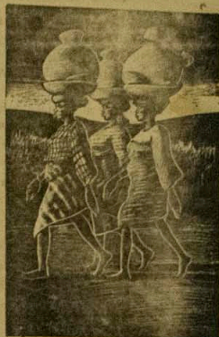
Aworan awon apon'omi ta ti a nwo yi kodi wipe ko ye ni a ma lo emi sofo, tititife ni ilu miran ni igba Nigeria yi, omo jaju soro ni awon eniti ti egi p'ari emi fe mumu si ilo.