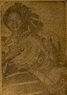
Enfo a nwo nina aworan yi ni Oleyide Olayemi ti o nso omo Heshi nigbatu o. ni ilu soro nibi alihan kau ti awon so nlu Oyiabo.