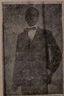
The Doyen Of Nigerian Politics