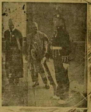
(Wo ero re loju ewe kofa)