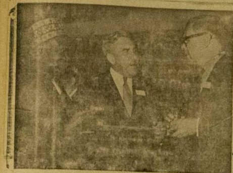
Alhaji Eni-ola Isa Kaita, C. B. E. Alajumọ awon ipade Ariwa- Nigeria, Sir James Robertson, Gomina Gbogbo-gbo akoko nile