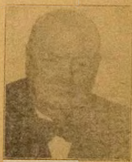
OLOTU IJOBA GESI (eniti o s'aju Ijoba Gesi)

GENEVA. Ni odun 1948 oju kewa nri Decemba ni awon eniti nilela ti o je Agwaja nita kikan ni o mbe lori ile aiyre pa apelo sibi Geneva ti ewe si panupo se ofin yi. Lakin gbo ofin na, ki awon te e sinu iwe. ki awon se mo agbari na. Iwe, ile egbe, ile onje, ile ere, ode gbagbala ati ni koro, ati Abuleko ati lona oko ki gboho awon lo ni ki awon si fi oju ara won kan nira iwe irohin iwe. Di enu awon ofin na ni woye.