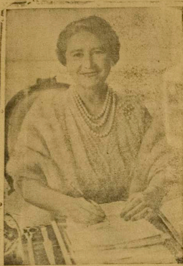
ỌLẸTII ná wọ́n tí wọ́n ń wọlé nínú àgbà ní iya Alayelowa oba Obinrin, Elizabeth Keji Iba Oyinko, tí ó ń wọlé nínú àgbà Goniwe gbojo-gboji ile Nígeria ní alejo sinu Afimọ́ls Buckingham eke nia London.

Leti na ni awon ẹmọ nina ena wa bi Adipo nlo Eke tabi lu Alakawa, ni ẹpe si su ẹgba ewe ni ifidi, ori be la ni awon rui epe ite ko si dar. / 4-jo fun ra won labin wipo fi ni 40 lo ni erin on ti se ni fi 40 g lo lo lu Alakaw eke ewe 40 on ko lo 40 Afimo 40 ni awon nina, l’otulaku lo si 14 14.