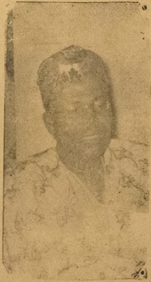
Oloye Awolowo ba awon enia soro pupo, o han won wipe oro ti lheru awon ilu kekeke ti awon (Wo yoku loju ewe keji)

JOS. Okiki kan nigbati olopa Oloye (Ghaferi Awolowo, alori egbe Afenifere (Action Group) ati Alakoso Ijoba Iwo-Orun (Premier) de iu Jos, ti ogunlogo awon omo egbe re wa pade re nisl olopa Ofurufu.