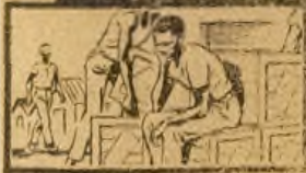
This was me a short time ago. Troubled with backache, tired and weak. Not enjoying work or sport.