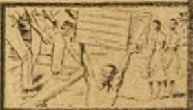
Now—no backache and I feel so well. Ready for anything, thanks to De Witt's Pills.