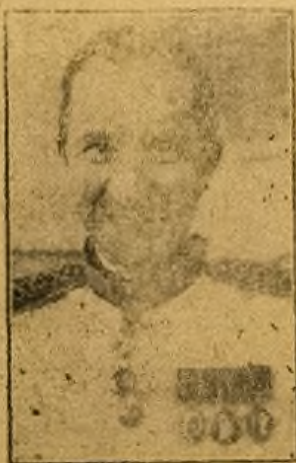
GOMI A MACPHERSON

A gbo wipe Dokita yi ni Asiwaju egbe Nigerian National Democratic Party ti o je alabasepo pelu egbe N.C.N.C. ni asiko na.